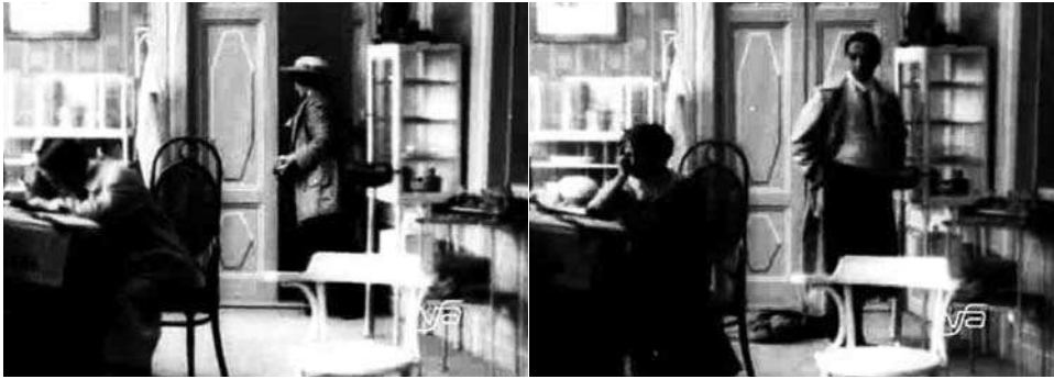
Obr. 9. Zub za zub.