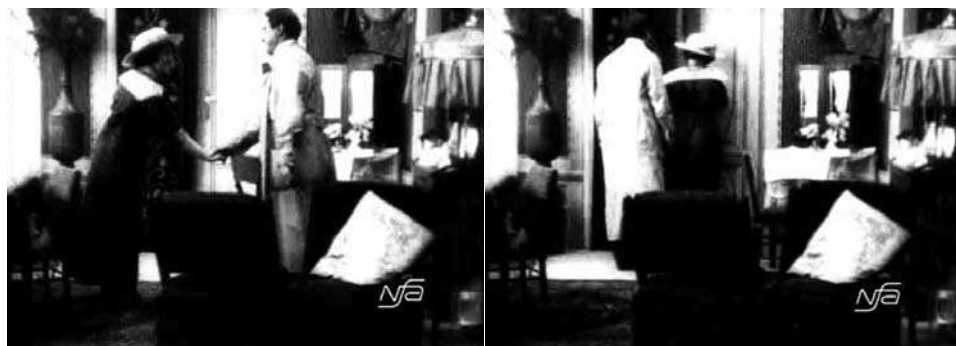
Obr. 14. Zub za zub.