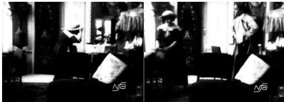
Obr. 12. Zub za zub.