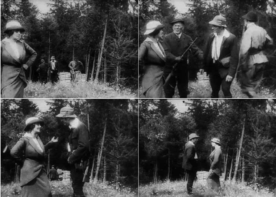
Obr. 1. Konec milování.

s přáteli (obr. 1). Ti se po chvílce konverzace od dvojice oddělí, díky čemuž jsou zřejmější sílící sympatie mezi hlavními postavami. Během družného rozhovoru se postupně vzdalují od kamery, přičemž jejich soulad je ještě akcentován jejich postupným přesouváním se do vyvážené kompozice v centru rámu.