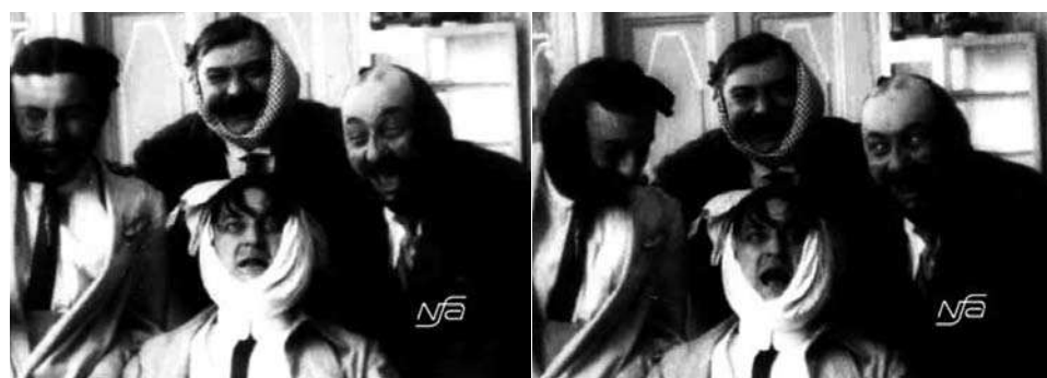
Obr. 18. Zub za zub.