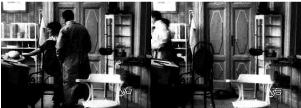
Obr. 11. Zub za zub.