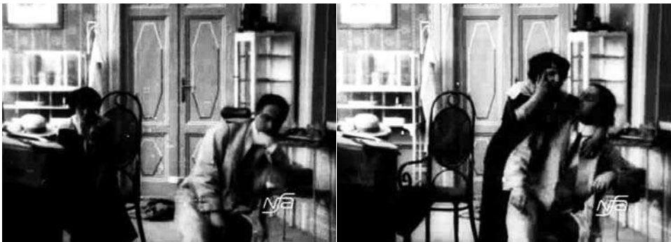
Obr. 10. Zub za zub.