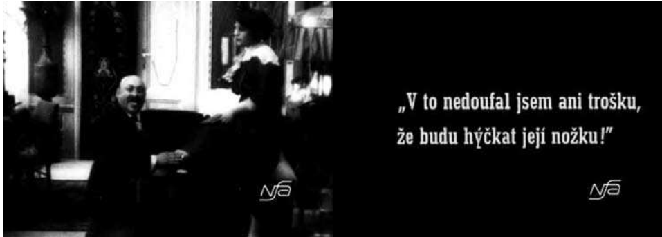
Obr. 17. Zub za zub.