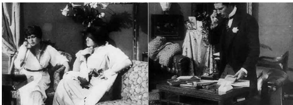
Obr. 3. Křížový střih: telefonní hovor.