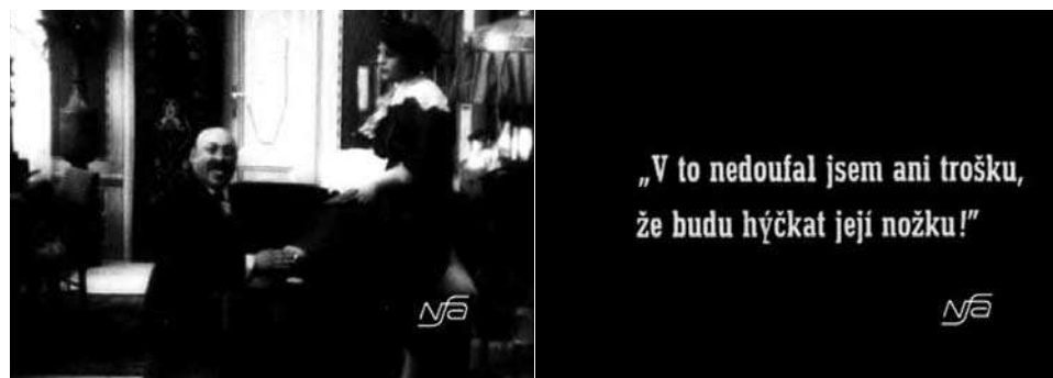
Obr. 17. Zub za zub.