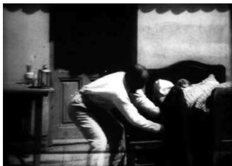
Obr. 6. Pro peníze .

Navzdory jednoduchému (a prostorově vysoce eliptickému) návaznému střihu je třeba Rudi na záletech inscenován striktně v tableau kompozicích, což ještě více platí pro prostorově zcela nenávazného Rudiho sportsmanem . Promyšlenější práci s tableau postupy vidíme však ve snímku Pro peníze , jenž pracoval s vyprávěním časově značně „výpusťkovitého“ příběhu. Je přitom snímán právě v dlouhých časoprostorově uzavřených nenávazných záběrech s občas překvapivě prostorově hloubkovými inscenačními volbami (střet předních a zadních plánů). Pokojové interiéry byly natáčeny venku před domy, což sice zřejmě působilo a rovněž dnes působí značně nevěrohodně. Mělo to ovšem překvapivě pozitivní důsledky pro práci s tableau postupy a přehlédnutelností herecké akce (bylo na ni dobře vidět). Za prvé byla rovnoměrně osvětlena celá scéna, čímž byla vyřešena potřeba umělého osvětlování akce. To bylo (nejen) u nás v té době standardní, jak ostatně píše v souvislosti se zeměmi s malou filmovou produkcí Bordwell s Thompsonovou: „Mnoho interiérových scén bylo natáčeno na otevřených scénách za slunečního svitu.“ (THOMPSONOVÁ a BORDWELL 2011: 86) Na druhou stranu toto rozhodnutí zajišťovalo bližší pozici kamery vzhledem k postavám, než bylo v daném období běžné, protože rám nesměl zabírat střechu, aby se udržovala iluze uzavřené místnosti.