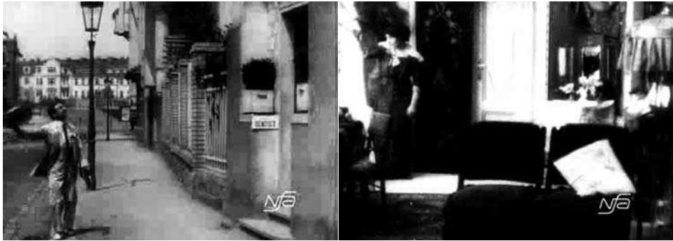
Obr. 15. Zub za zub.

cem“. 9 Pantomimicky se s ním na něčem domlouvá, pan Bílý jí políbí ruku a ona vejde do domu, zatímco on netrpělivě stále v tomtéž záběru přechází před domem. V určitou chvíli se zadívá nahoru do oken, smekne, přikývne a potěšeně vchází do domu. Následuje záběr na Milenu u okna, kde očividně dávala panu Bílému znamení (obr. 15): jde o jediné dva záběry ve filmu spojené návazností pohledu – střih ve směru pohledu pana Bílého ustaví prostorovou vazbu mezi ulicí před domem a obývacím pokojem Chudobových.