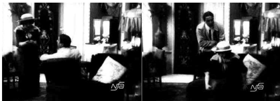
Obr. 13. Zub za zub.