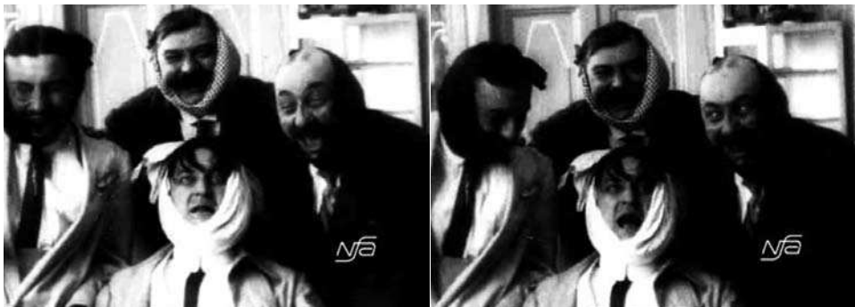
Obr. 18. Zub za zub.