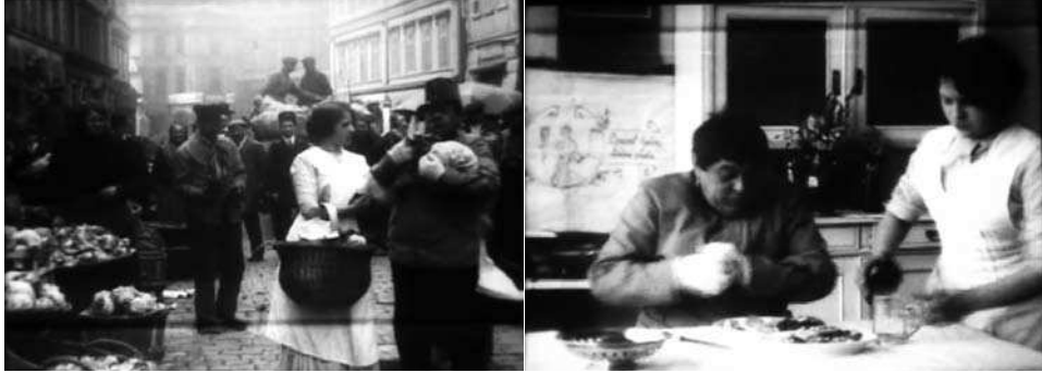
Obr. 7 / 8: Pět smyslů člověka.

samotné téma rozsáhlého poetologického propojení kabaretní a filmové kultury v českých zemích ještě čeká na zpracování. Možný vliv kabaretu vidím ve třech aspektech tvorby Kinofy, které se v komediálních dílech objevovaly společně a v nekomediálních zejména třetí z nich: (a) struktura skeče, v níž je důraz na silnou pointu, která nemusí nutně vyplývat z logického plynutí dosavadních událostí, (b) performativní herectví: obrácení se na diváka, narušování iluze uzavřeného časoprostoru, (c) mediální performativnost: technické možnosti filmu, sebeuvědomělé funkce mezititulků.