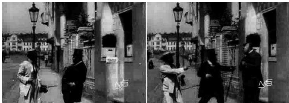
Obr. 16. Zub za zub.

Ozvláštňením narativního vzorce pak prochází i dvojice scén s napálením jednotlivých nápadníků: pana Bílého Chudoba nutí dojít do ordinace pouze gesticky, zatímco u pana Tučného je situace doplněna o neustálé Chudobovo vyhrožování Tučnému střelnou zbraní. Ačkoli je tedy narativní organizace cyklická, filmaři se snažili posílit komický efekt nad rámec prostého opakování stejné situace.