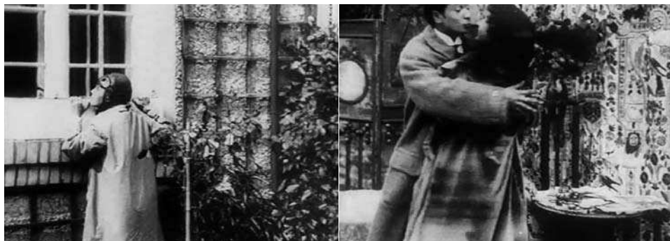
Obr. 4. Návaznost pohledu: snoubenka vidí přes okno svého milého v náručí sokyně.